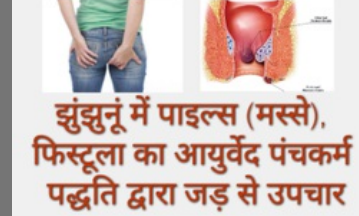
Piles Medicine In Jhunjhunu