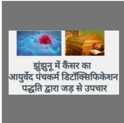
Ayurvedic Cancer Medicine In Jhunjhunu