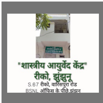
Ayurvedic Doctor Jhunjhunu