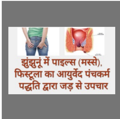
Piles Care Capsules In Jhunjhunu