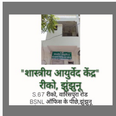
Ayurvedic Doctor In Jhunjhunu