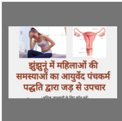
Ayurvedic Gynecologist Doctors In Jhunjhunu