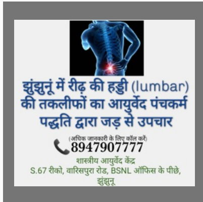
Spondylitis Treatment in Jhunjhunu