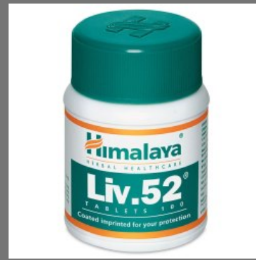
Liv 52 Tablet In Jhunjhunu