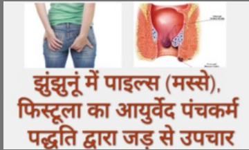
Ayurvedic Medicine For Piles In Jhunjhunu