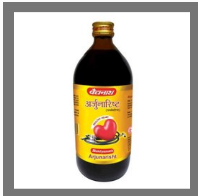
Arjunarist In Jhunjhunu