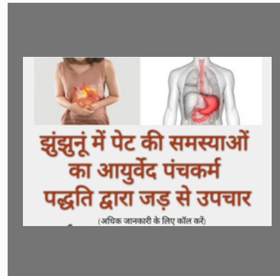
Acidity Ayurvedic Medicine In Jhunjhunu