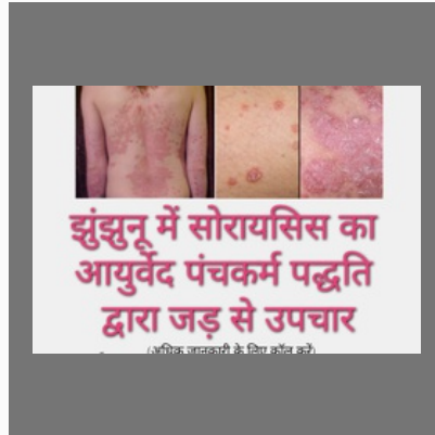
Psoriasis Medicine In Jhunjhunu