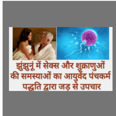
Sexual Problem Treatment in Jhunjhunu