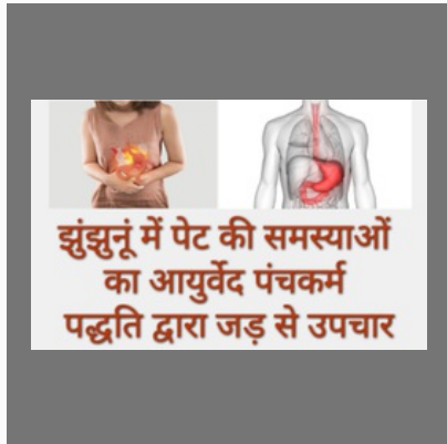
Gastroenterology Treatment In Jhunjhunu