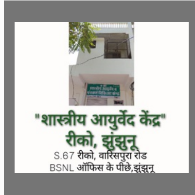
Ayurveda Clinic In Jhunjhunu