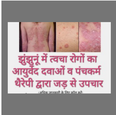
Dermatologist In Jhunjhunu